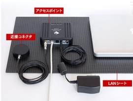
セキュリティ LANシート