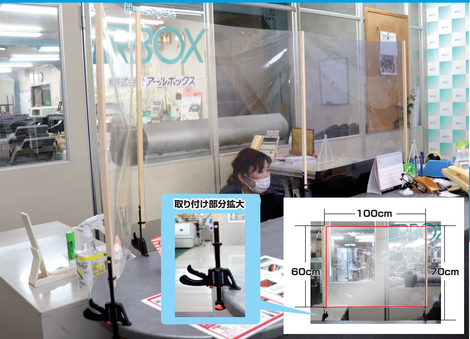
取り付け部分拡大