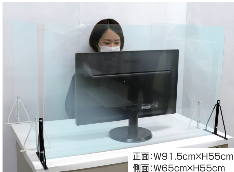
正面: W91.5cm×H55cm 側面: W65cm×H55cm